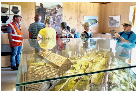
Die Exkursion führte auch in den Museum-Stall des Museums Montlingen am Montlingerberg.

Herzlichen Dank, geschätzte HVW-Mitglieder, für Ihre verlässliche Unterstützung der vielfältigen Aktivitäten unseres Vereins. Ebenso danken wir allen weiteren Personen, Behörden und Institutionen, die sich für den HVW und das historischkulturelle Erbe der Region einsetzen.